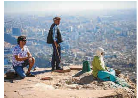
Vista panorámica de la ciudad desde el monte Murdjadjo.

EL OBJETIVO ES CREAR LAZOS ENTRE ARTISTAS DE DIFERENTES PUNTOS DEL MEDITERRÁNEO