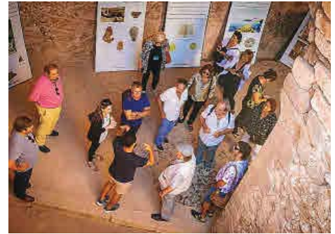
Visita al fuerte de Santa Cruz.

En Orán no puede faltar un recorrido por sus mercados, bullicio de vendedores y consumidores, en los que llama la atención la notable presencia de productos españoles envasados y un ambiente que, salvando las distancias, recordaba a los ojos de los visitantes isleños los mercados