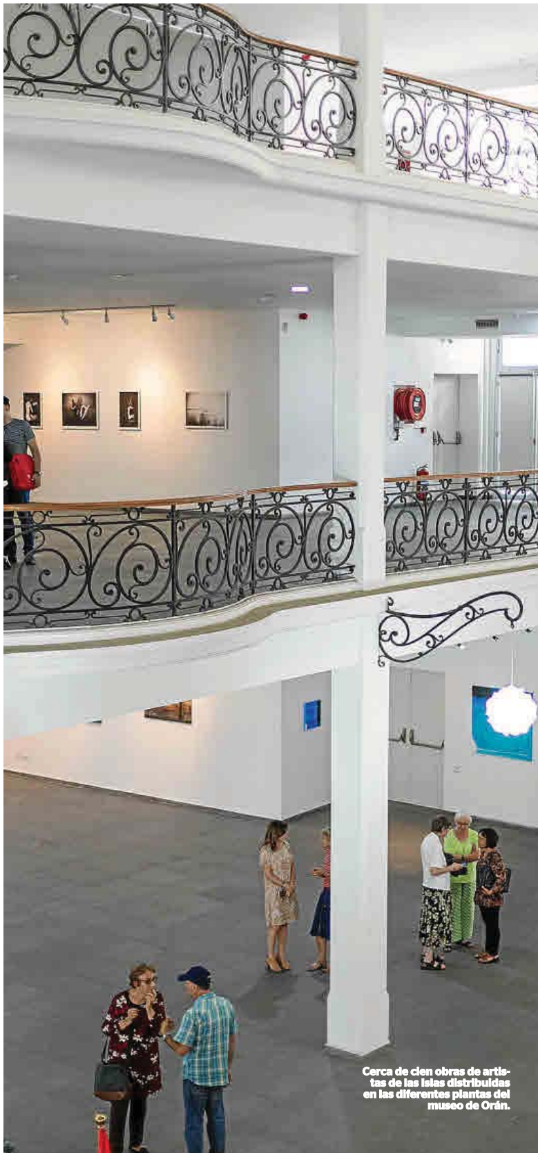
Cerca de cien obras de artistas de las islas distribuidas en las diferentes plantas del museo de Orán.