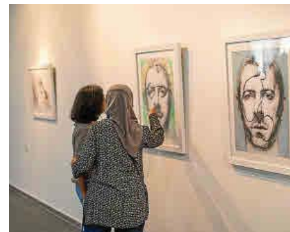
A la izquierda, la iglesia de Santa Cruz vista a través de uno de los muros del fuerte del mismo nombre. Sobre estas líneas, público de Orán visitando la exposición.

Texto: LOURDES TERRASA