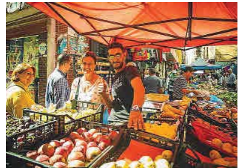
Recorrido por los mercados de Orán.