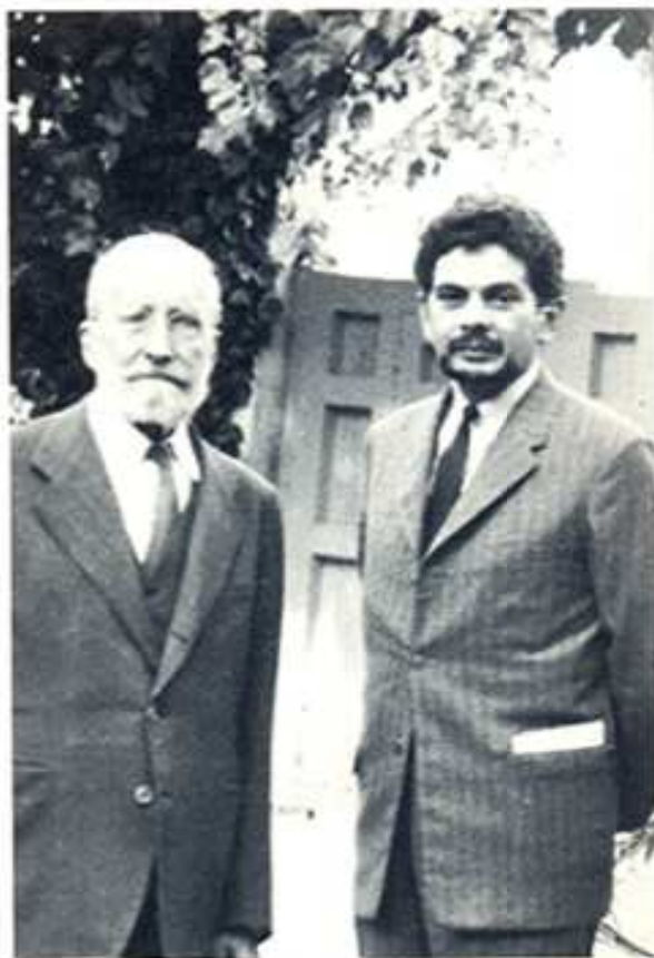
amb Ramón Menéndez Pidal, Chamartín 1964

Conseqüent amb la seua vocació de rodamón no creia en l'amor en singular, sinó en els amors. Acceptava experiències com la promiscuïtat i manca de pudor esquimal, la ritualitat de les geishes nipones o la fredor de les noies russes, però no entenia que l'amor s'haguera convertit descaradament en una mercaderia al Soho de Londres. Als seus amors els va anomenar: "Ocell groc", anglesa, cerebral de 23 anys; "La