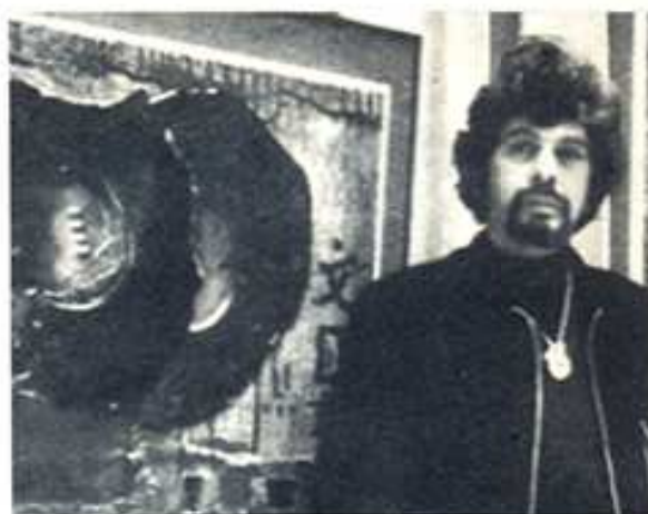
Club Pueblo, Madrid