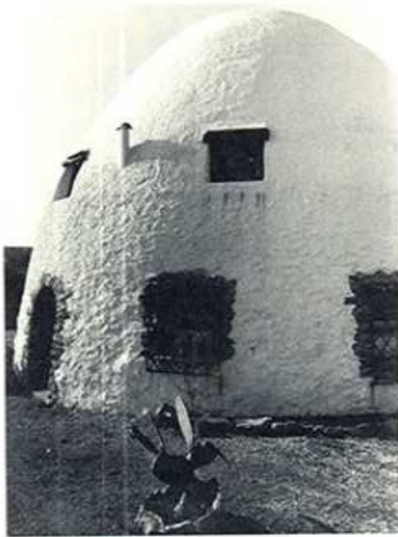
Igloo, Cap de Sant Antoni