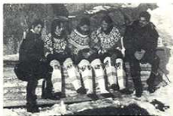
Groenlàndia acompanyat d'esquimals, 1964