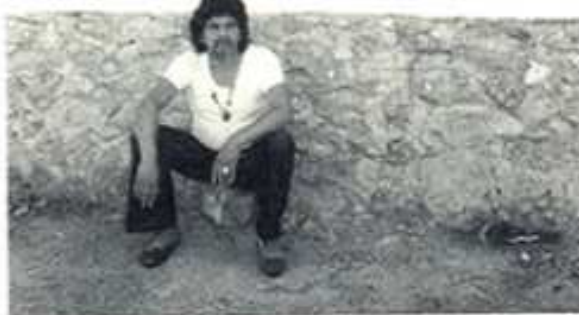
Cova dels Porcs, Benidoleig

Bruixa", holandesa de 24 anys, amb gran sensibilitat per la pintura; "Bon dia tristesa", nòrdica de 19 anys, ella li va fer descobrir la condició efímera de l'amor; "Katán" neozelandesa de 24 anys, sempre anava amb un mico i era bella i gelada en la passió; "Plorona", un amor secret de 18 anys ple de sinceritat, sacrifici i risc; Nieko, del Japó, va romandre més temps que totes en el seu record i "Charlie Chaplin" va ser la dona que més va estimar.