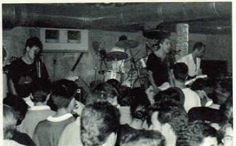
Inflamables al Graffiti

En esta dècada, els ajuntaments van sembrar la comarca de Cases de Cultura, fenomen que va donar un gir a l'oferta i vida cultural dels pobles. Esta descentralització va tenir el seu punt negatiu davant el perill de la institució del fet que "tot val", però les convocatòries de certàmens de