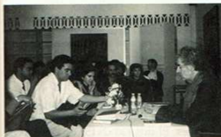
Agustín García Calvo. Encuentros de Filosofía en Dénia