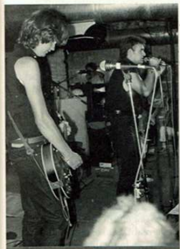
La Rendición. Graffiti