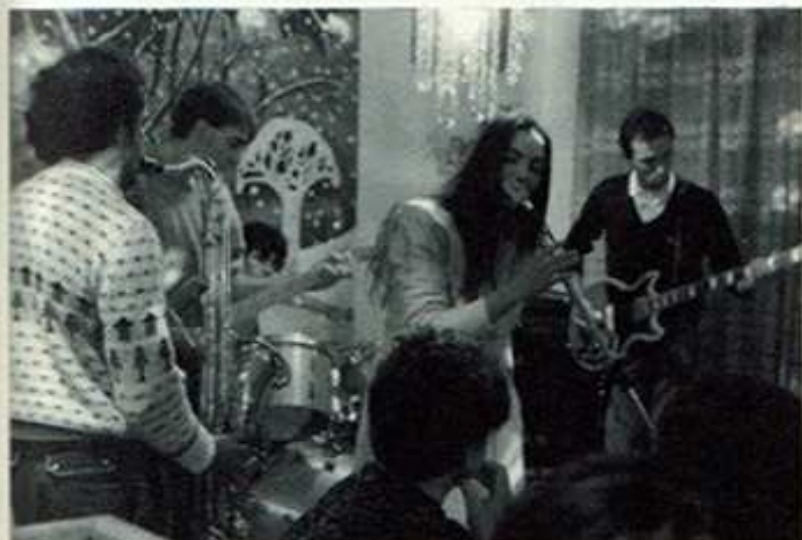
Nuevos Modales al Quatre Estacions

Impossible citar tots els que van estar, però en l'àmbit de la música van sorgir bandes de rockabilly: Al Límite (Calp) i Fharaons (Xàbia, Benissa); heavy: Cap de Lleó, després Trull (Dénia); pop: Sin Comentarios (Benissa), Polígono Industrial i Tetuán (Dénia), Sisí Bemoll i Banda la Xapa (Pego); mod: Nuevos Modales (Dénia); rock: La Banda Salvaje i La Rendición (Xàbia, Benissa) i Inflamables (Dénia): segons classificats en les dues edicions del Concurs de Pop-Rock de la Marina Alta que va guanyar en 1987 Staff (Pego) i en 1988 Ala Delta (Orba).