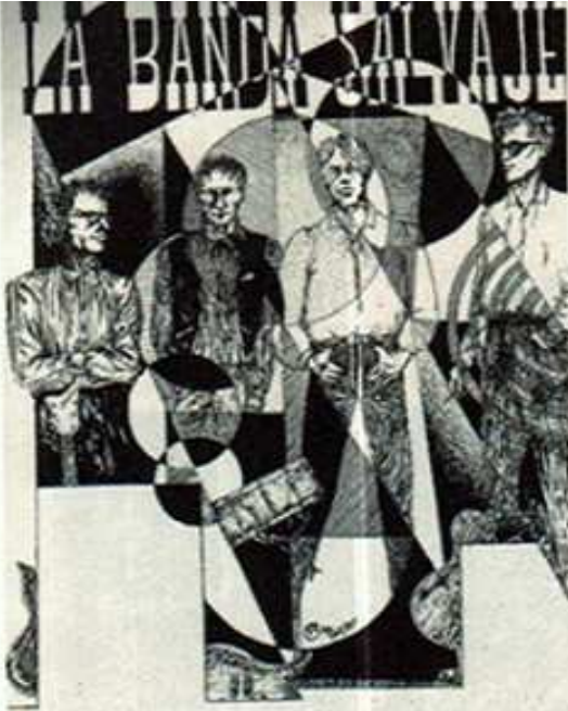
La Banda Salvaje

Palmera (Orba)... van innovar i van crear una ruta de subcultura nocturna. El complement estava als carrers i zones de marxa en les quals va destacar l'Om, l'Ona, Riu de baix, Achilipub... que van institucionalitzar els carnestoltes de Pego com a referent de la moguda comarcal; l'inaudit aparador de locals de l'Arenal de Xàbia; Sarao a Orba; La Garrofa a Parcent; Sumbawa al Verger; Quatre Estacions, Eufòria, Verdolaga i Desirée a Pedreguer; terrassa Quattro a la Xara; Lluna Plena a Teulada; Amsterdam, Dumbo, Macondo, Xaloc, Lennon... i el carrer calent de les Marines a Dénia. A la fi dels 80 va aparèixer la sala Graffiti a Pedreguer, temple de la modernitat de la comarca, sala de concerts amb ambient de garatge